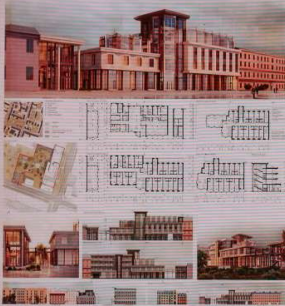
Работа 2 курса