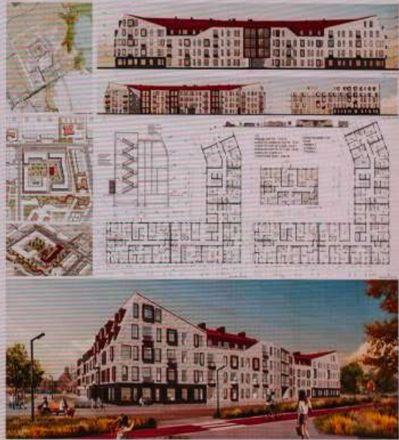
Работа 3 курса

САНКТ-ПЕТЕРБУРГСКИЙ ГОСУДАРСТВЕННЫЙ АРХИТЕКТУРНО-СТРОИТЕЛЬНЫЙ УНИВЕРСИТЕТ