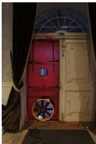
Figure 12. BlowerDoor pressure tool (Riga)