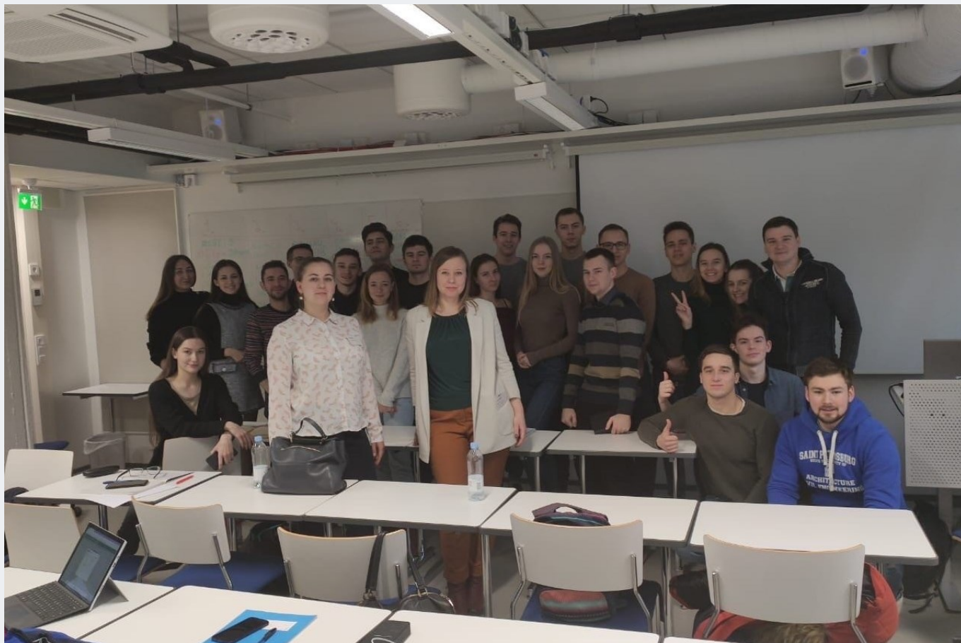
Студенты ИСИ учатся по программе двойных дипломов в Финляндии