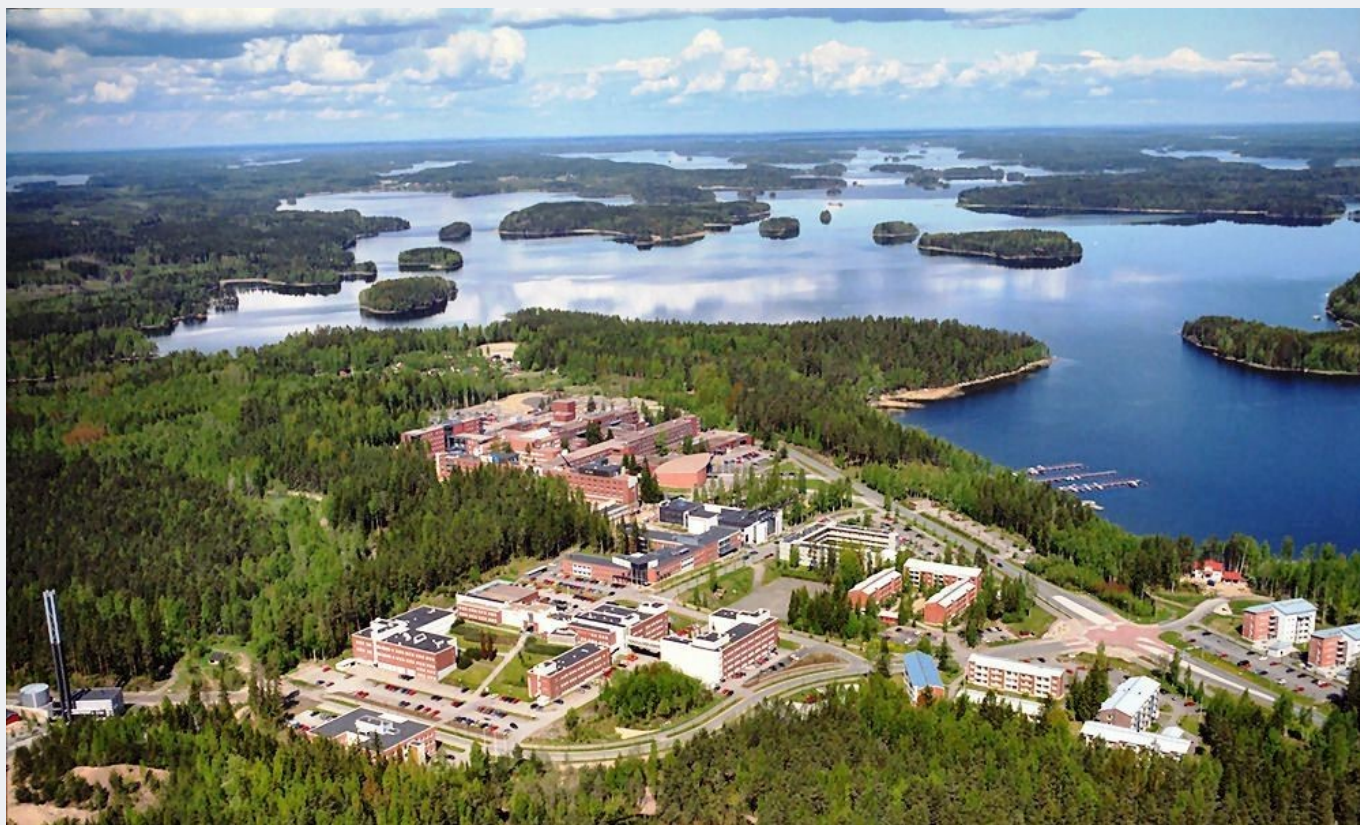
Так выглядит изнутри кампус LAB University of Applied Sciences.