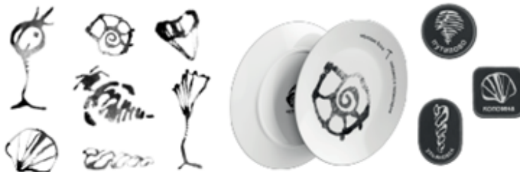
Разработка фирм графики