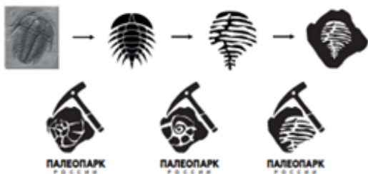
Разработка фирм блока