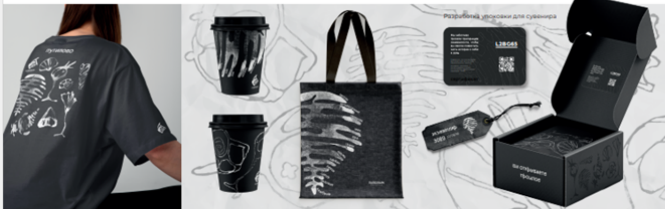
Разработка упаковки для сувенира