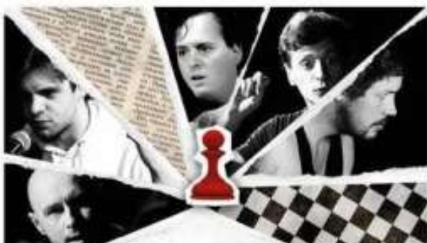
Кадры из анимационного ролика