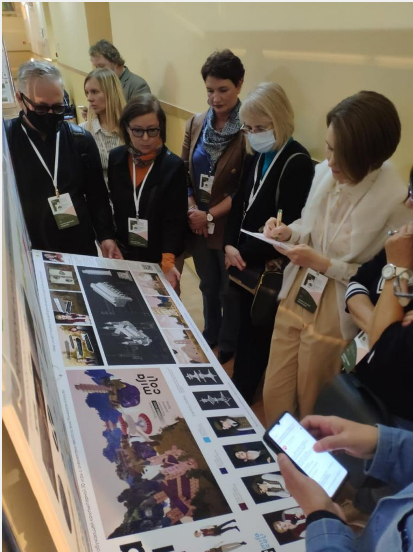
Делегация Высшей школы дизайна и архитектуры под руководством и.о. директора,